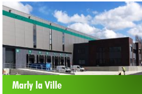
Marly la Ville