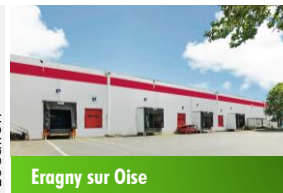
Eragny sur Oise