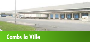
Combs la Ville