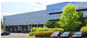
Savigny le Temple