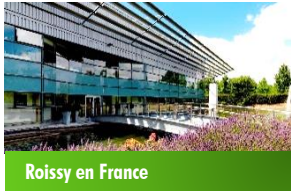
Roissy en France