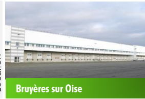
Bruyères sur Oise