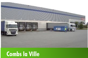
Combs la Ville