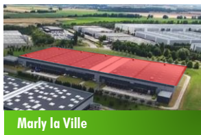
Marly la Ville