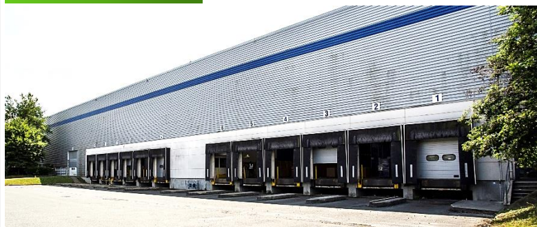
Combs la Ville