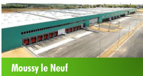
Moussy le Neuf