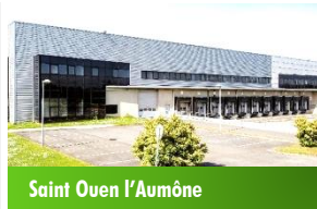
Saint Ouen l'Aumône