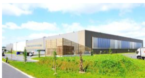
Ferrières en Brie